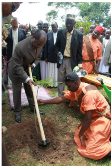
een boom geplant bij de kleuterschool