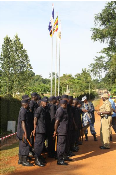
bewakingsleger krijgt instructies.

Dit hele evenement trok uit de wijde omgeving belangstelling en dus werd het terrein zwaar bewaakt door politie, leger en Royal guards. En uiteraard onze eigen bewaking.