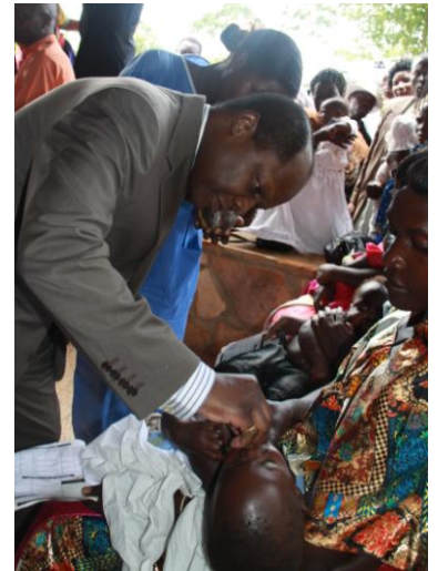
polio inenting door de koning

We hebben hem met gepaste trots laten zien wat we hier doen, hij heeft het kinderruimte bezichtigd, officieel de kliniek geopend, een paar