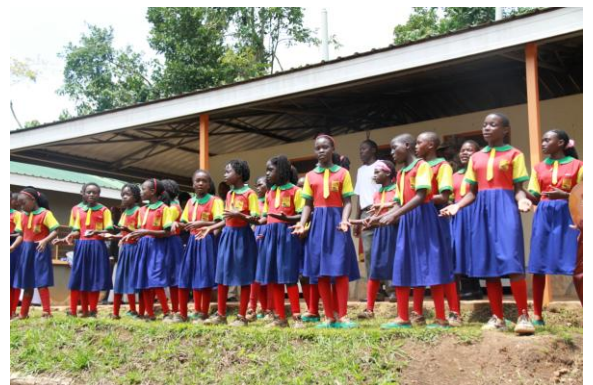
kinderen zingen de koning toe bij het openen van de kliniek