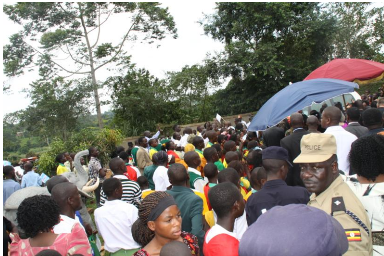
een mensen massa, iedereen wilde de koning zien.

Wij hadden een prachtige gelegenheid om uit te leggen uit welke motivatie we dit werk mogen doen.