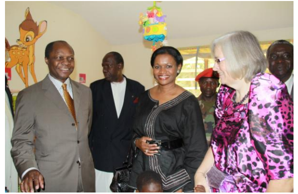
Pita verteld de koning en koningin over de baby's

Wat een feest! De kinderen waren zo blij, een echte koning die bij je op bezoek komt terwijl je in de ogen van het volk een niemand bent, dat maakt je IEMAND!