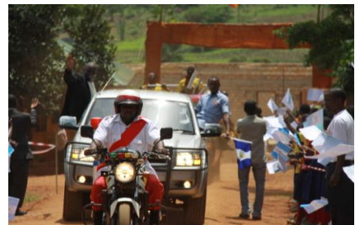
aankomst van de Koninklijke stoet.