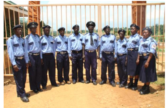
ons eigen bewakingskorps

Dit hele evenement trok uit de wijde omgeving belangstelling en dus werd het terrein zwaar bewaakt door politie, leger en Royal guards. En uiteraard onze eigen bewaking.