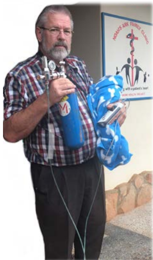
Baby gered en aan zuurstof

Zo, alweer bijna een jaar om; we kijken nog even terug voor we 2018 in gaan. Bovenaan staat voor ons God, die ons leidt en Zijn gunstbewijzen aan ons getoond heeft! We hebben enorm veel zegen mogen ervaren in het werk dat Hij op onze schouders heeft gelegd.